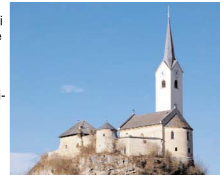
Križev pot na Kamnu

V času turških vpadov v Podjuni (1476 in 1483) je cerkev, ki je bila sprva gorska kapela, dobila utrdbo, ki je služila okoliškemu prebivalstvu kot zatočišče. Znamenja na križevem potu vzdolž pešpoti do cerkve iz 2. polovice 20. stoletja so vredna ogleda.